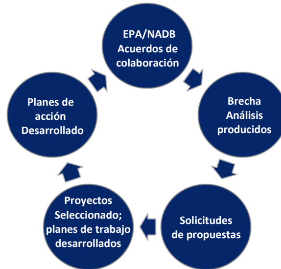
Figura 3: Proceso de planificación del programa Frontera 2020