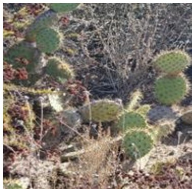
Cactus en el estuario de Tijuana, un sitio del proyecto Frontera 2020.

El programa Frontera 2020 representa un plan binacional a ocho años celebrado el 8 de agosto de 2012 entre Estados Unidos y México, y ha sido diseñado con el objetivo de "proteger el medioambiente y la salud pública en la región fronteriza entre EE. UU. y México". El programa Frontera 2020 tiene por finalidad mejorar las