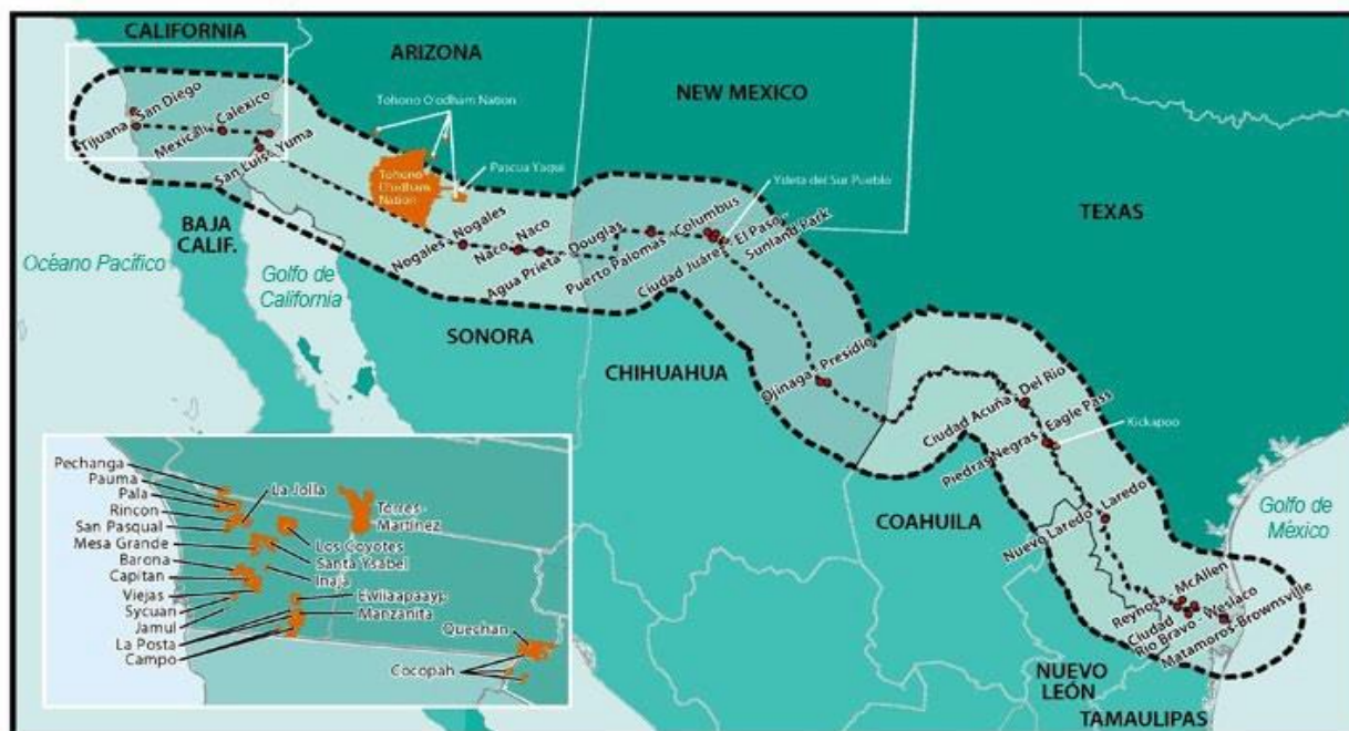
Figura 1: Mapa de la región fronteriza entre EE. UU. y México

Se desarrollaron estas metas y objetivos en función de los aportes realizados por grupos de interés y socios del programa, así como tomando en cuenta los desafíos para el medioambiente que aún se presentan en la frontera. En la figura 1, se ilustra la región fronteriza entre EE. UU. y México, que se extiende por unas 2,000 millas desde el Golfo de México hasta el Océano Pacífico e incluye más de 60 millas a cada lado de la frontera, lo que afecta a cuatro estados de Estados Unidos y seis de México.